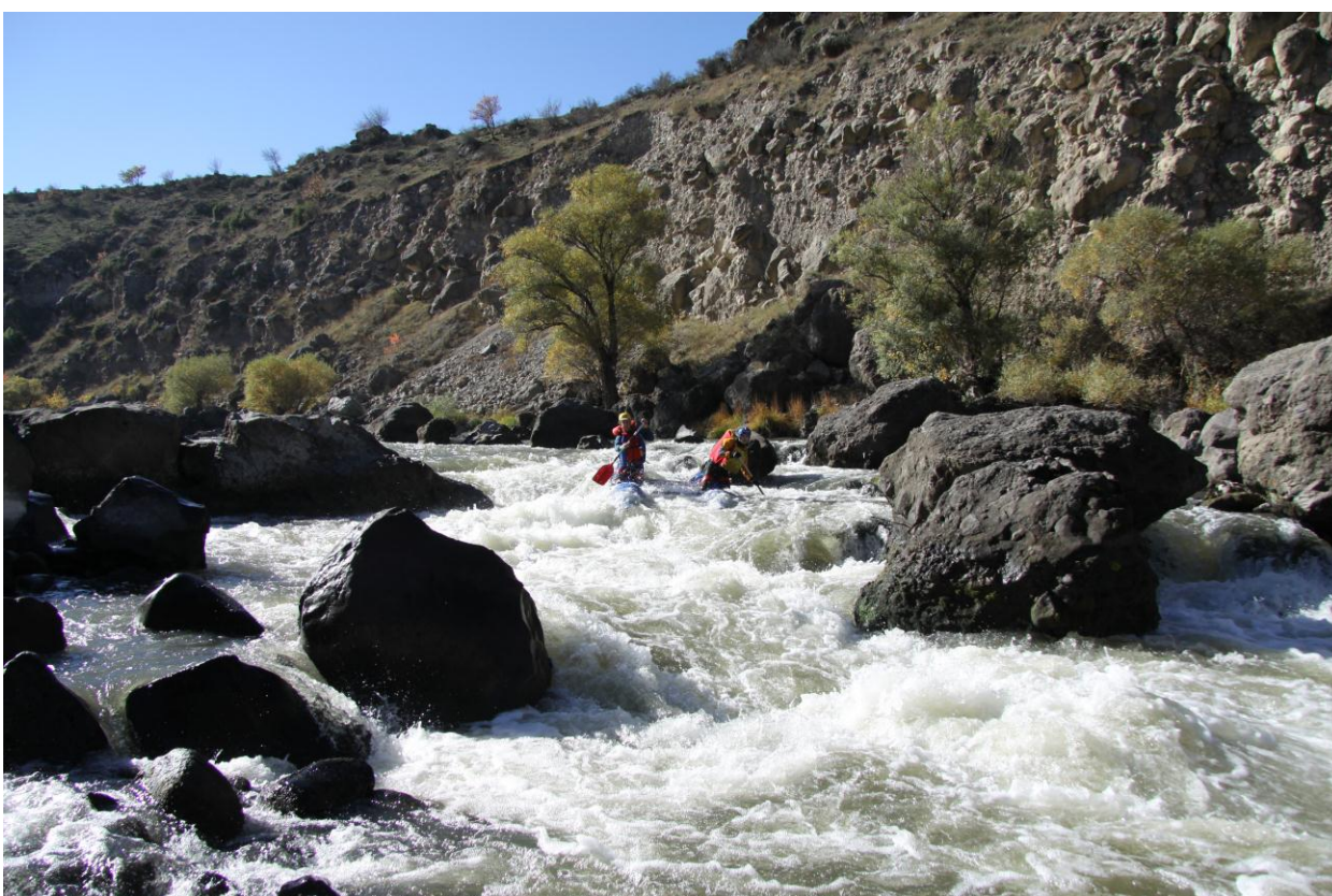
Прохождение порога 4 к.с. в каньоне усиленным экипажем Галедин В.П., Волков А.С. (Точка 4, карта №1).