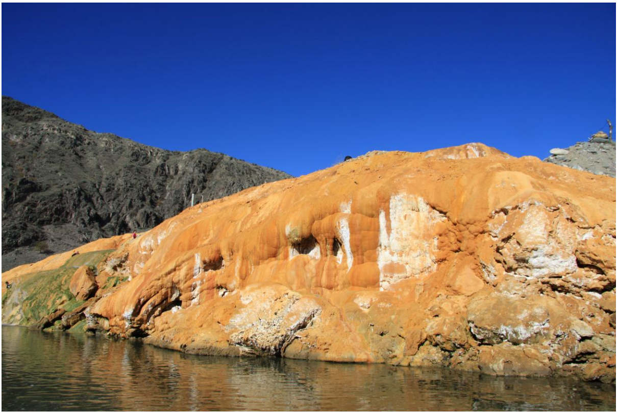
Горячий минеральный источник на правом берегу (точка 5, карта №1).