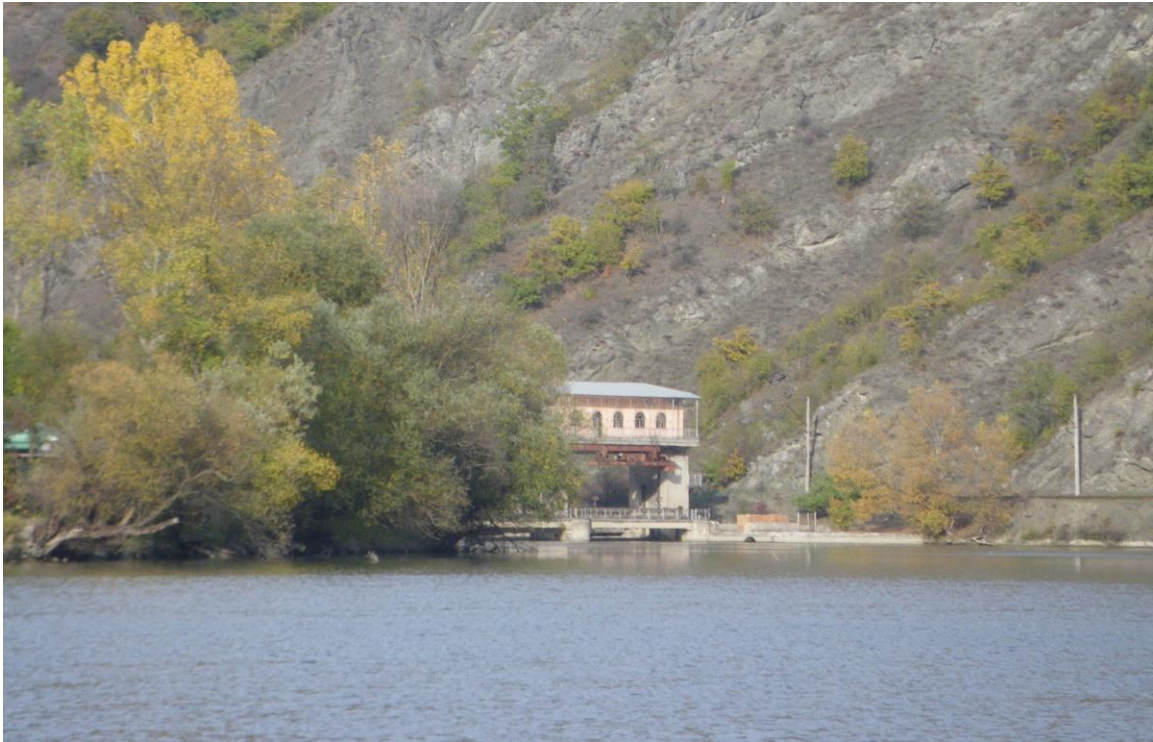
Плотина у пос. Двири.