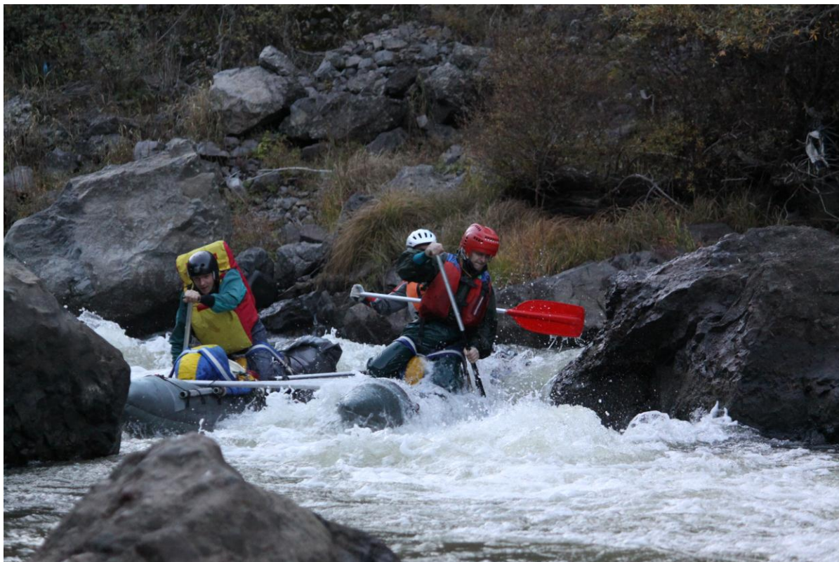
Кат 4-2 в каньоне.

Перед вторым сложным препятствием в каньоне, требующем разведки (точка 4, карта №1), обе группы прекратили сплав из-за наступающих сумерек. Поднялись к дороге на правом берегу и разбили лагерь у заросшего камышом озера (точка 5, карта №1).