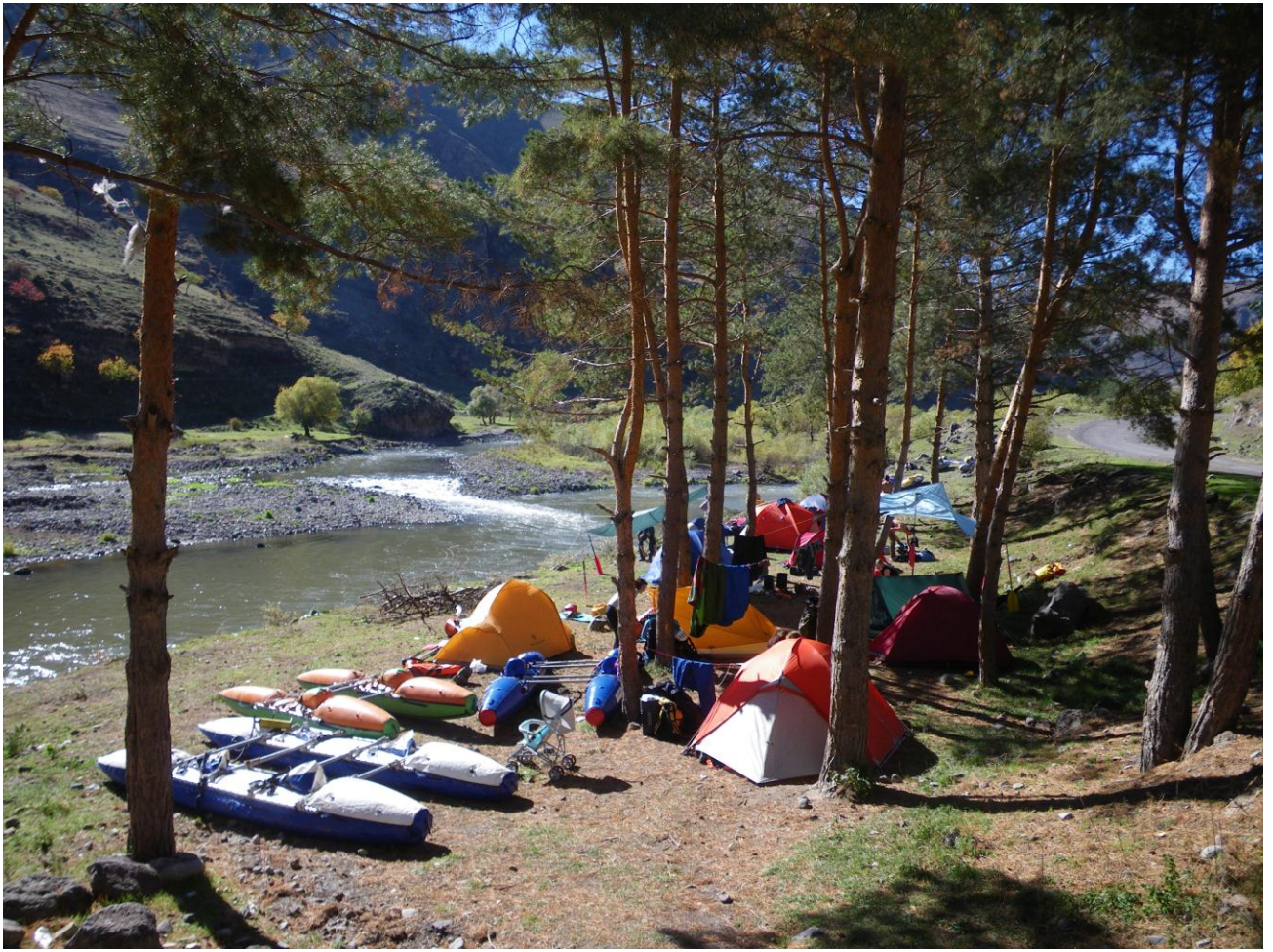
Место стапеля (точка 1, карта №1)

Утром провели часовую тренировку на собранных судах, повторили навыки работы со спасконцом и проверили все личное и групповое снаряжение. Перед обедом сходили на обзорную экскурсию по монастырю 12 века. В 15:00 группа г.Королева и в 16:00 группа г. Красноармейска покинули место стапеля.